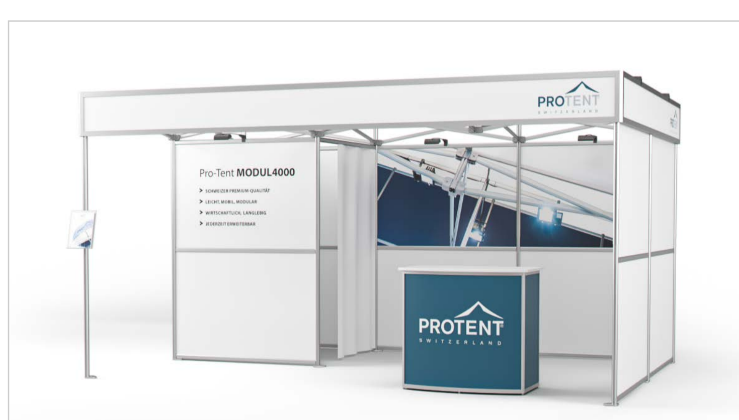
Pro-Tent System-Messestände – die modulare Lösung für KMUs und Start-Ups – von 2 Personen ohne technische Vorkenntnisse mit wenigen Handgriffen montiert.