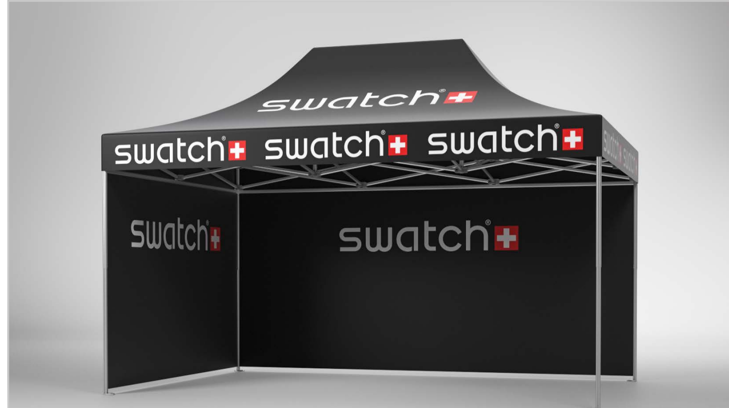
Pro-Tent MODUL 4000 – das patentierte Faltzeltssystem für die perfekte Event-Präsenz